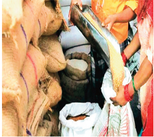
हरिभूमि न्यूज | राजगढ़

सार्वजनिक वितरण प्रणाली (पीडीएस) के तहत जिले के सभी पात्र उपभोक्ताओं को इसी अप्रैल माह में मई एवं जून का भी इकट्ठा राशन देना शुरू कर दिया गया है। विभाग ने सभी राशन दुकानों पर गेहूँ, चावल, शक्कर, नमक आदि पहुंचावा भी दिए हैं। गत 13 अप्रैल से जिले के 12 लाख 89 हजार के लगभग पात्र हितग्राहियों को राशन का वितरण आरंभ कराया गया है।